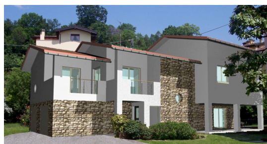
Rendering di Progetto