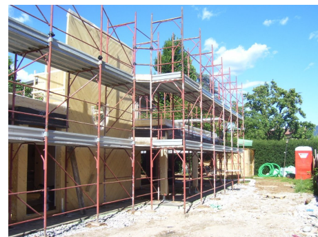
Fotografie del Cantiere