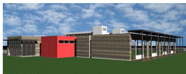
Rendering di Progetto

Vi preghiamo di inviare conferma della Vostra partecipazione via e-mail all'indirizzo info@archigiovani.brescia.it oppure a mezzo fax al n° 030.9134644, allegando il modulo di adesione, entro la mattinata di VENERDI' 25 GIUGNO 2010.