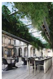
Nicolino & Ratti _ Ristorante Trussardi