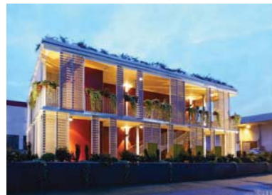
Designo srl _ Easy Building System