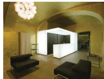
STUDIO 74 _ Before Jeans N Dress

Immagini in alta risoluzione presenti su: